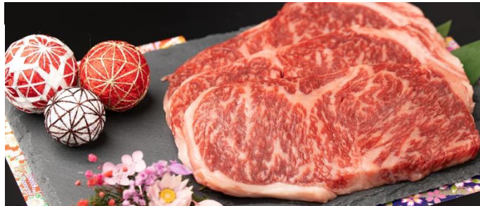
↑計画策定支援を行ったお客様の自社ブランド牛