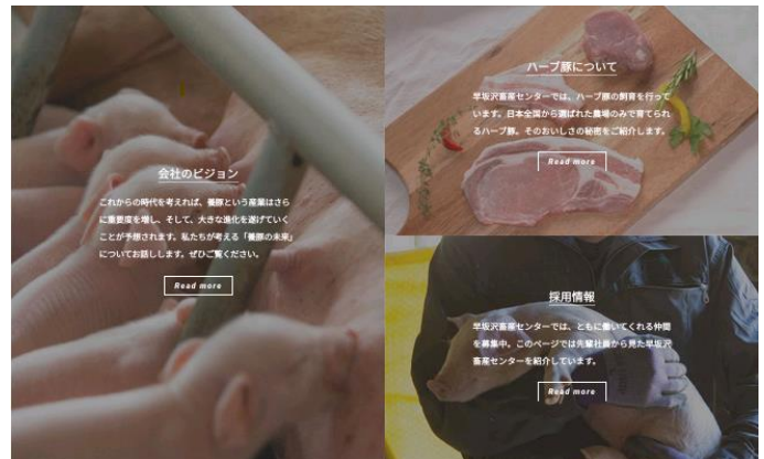
↑マッチング支援を行ったお客様のHP画像