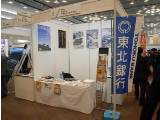
【とうぎんアグリビジネスクラブのブース】