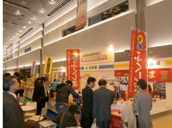
【東北物産展の様子】