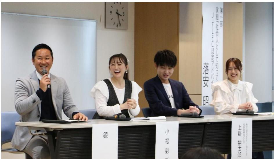
↑ 楽しい学びを提供してくれたパネリストの皆さん