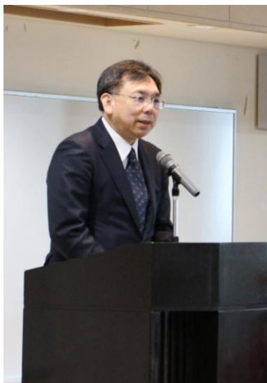
↑ 堀本金融庁総合政策局長は「岩手モデルを全国へ」と期待